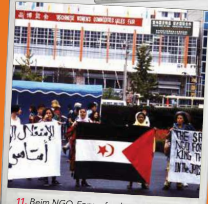
11. Beim NGO-Forum fanden auch zahlreiche Kundgebungen statt, so auch zum noch immer ungelösten Westsahara-Konflikt.