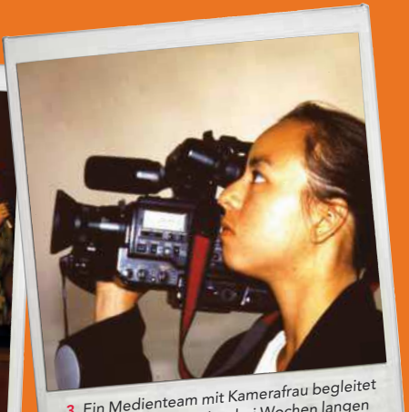
3. Ein Medienteam mit Kamerafrau begleitet den Zug während der drei Wochen langen Reise von Helsinki nach Peking.