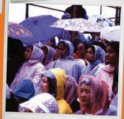
8. 30.000 NGO-Vertreter_innen nahmen am Forum teil.