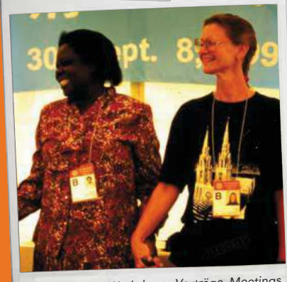
10. Zahlreiche Workshops, Vorträge, Meetings, Lobbygruppen und Info-Stände wurden während des Forums organisiert.