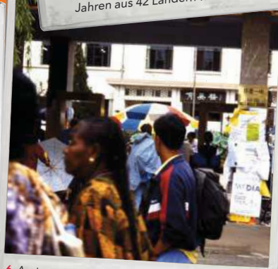
6. Austragungsort des NGO-Forums war Huairou – aus politischen Gründen fand es 35 km von Peking entfernt statt und bedurfte einer umständlichen Anreise. Hier Teilnehmer_innen auf dem Weg zum Forum.