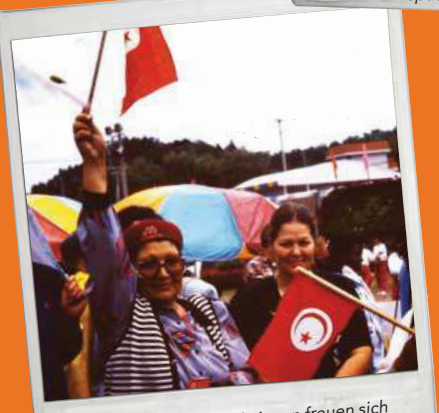
9. Tunesische Aktivistinnen freuen sich über ihre Teilnahme.