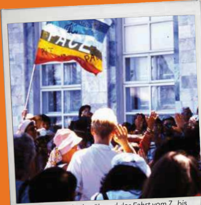
4. Der Zug hielt während der Fahrt vom 7. bis 29. August 1995 in St. Petersburg, Kiew, Bukarest, Sofia, Istanbul, Odessa, Almaty und Peking. Ein geplanter Stopp in Uyghur City of Urumqi wurde von der chinesischen Regierung nicht genehmigt.