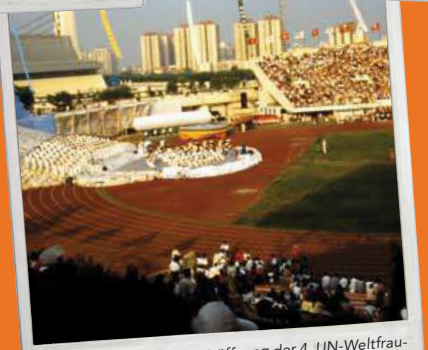
12. Feierliche offizielle Eröffnung der 4. UN-Weltfrauenkonferenz am 4. September 1995. Die Konferenz endete am 15. September mit der Verabschiedung der Pekinger Aktionsplattform.