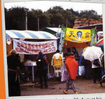
7. Das NGO-Forum fand von 30. August bis 8. September 1995 auf einem 350.000 m 2 großen Areal statt und trotzte jeder Wetterlage.